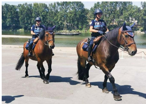
Brigades équestres : Il est depuis plusieurs années recherché en France et à l'étranger