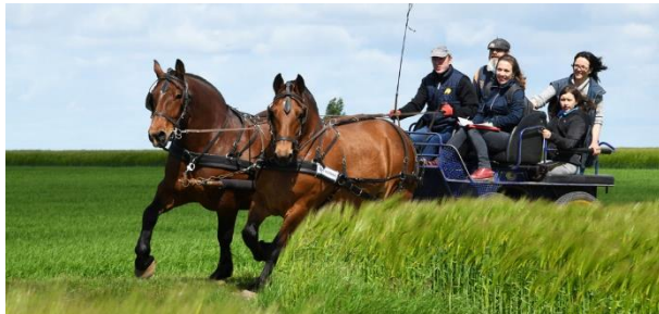
Aussi bien à l'attelage que sous la selle